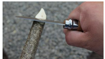
Bitte vorher anmelden!