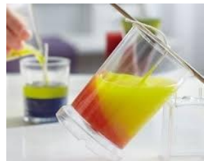
Bitte vorher anmelden!