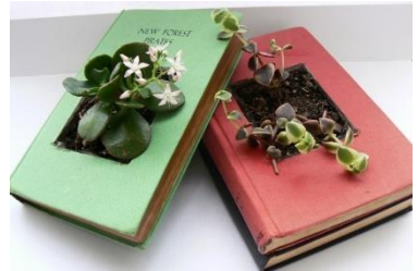
Bitte vorher anmelden!